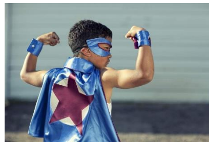
Sebastián reconoce y valora sus fortalezas.

1.- ¿Cómo imaginas que se siente cuando enfrenta un nuevo desafío? Marca con una x CONFIADO _____ TEMEROSO _____ INSEGURO _____