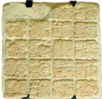
► Escritura jeroglífica maya.