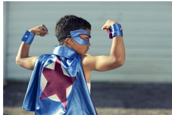
Sebastián reconoce y valora sus fortalezas

INICIO: ACTIVIDAD Observa las imágenes1.- ¿Cómo imaginas que se siente Sebastián cuando enfrenta un nuevo desafío? Marca con una X las respuestas