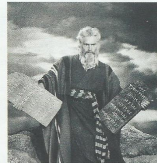
Imagen de la película Los diez mandamientos en la que aparece Moisés recibiendo las tablas de la Ley