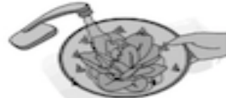
C. Lavar las verduras