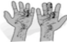
B. Ensuciarse las manos