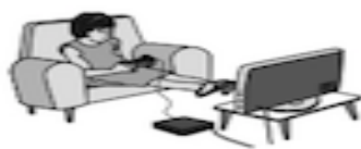
A. Jugar videojuegos

1. Encierra en un círculo la imagen o las imágenes de hábitos que ayudan a tener un cuerpo sano.