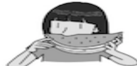
C. Comer fruta