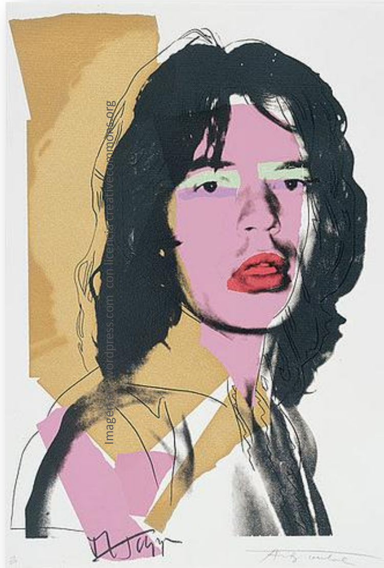
Mick Jagger de Andy Warhol