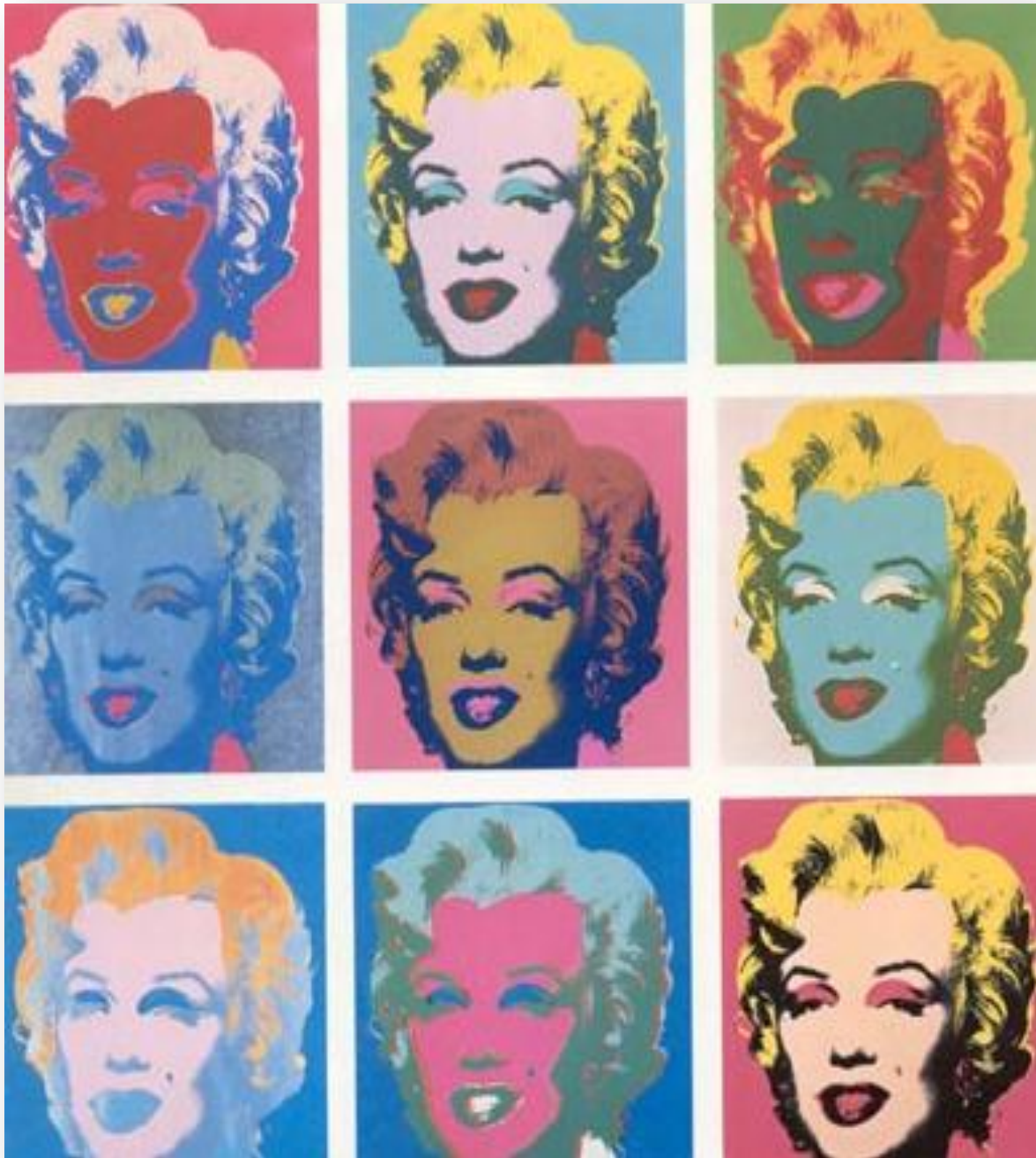
Marilyn Monroe de Andy Warhol