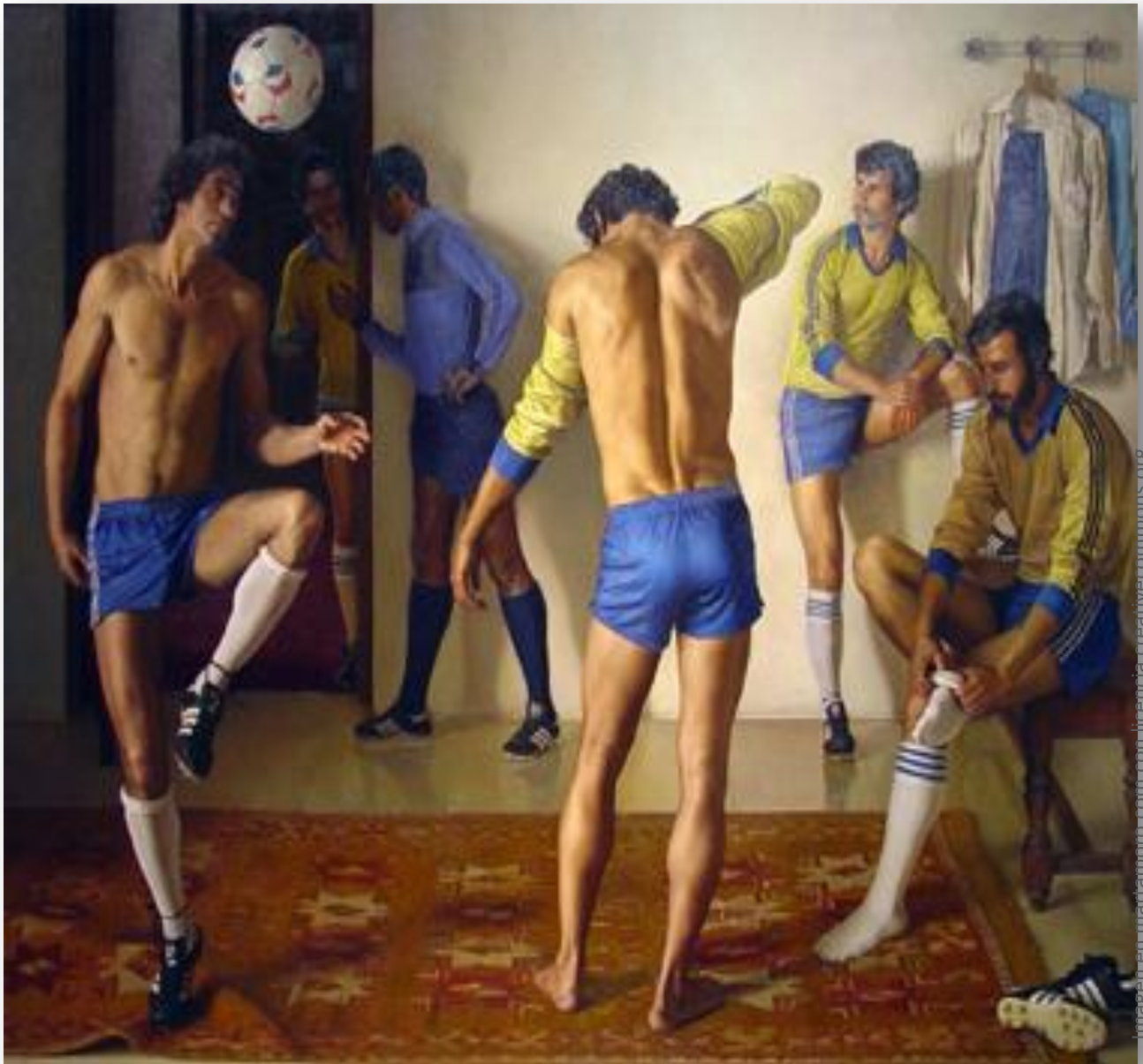
Antes del partido de Claudio Bravo