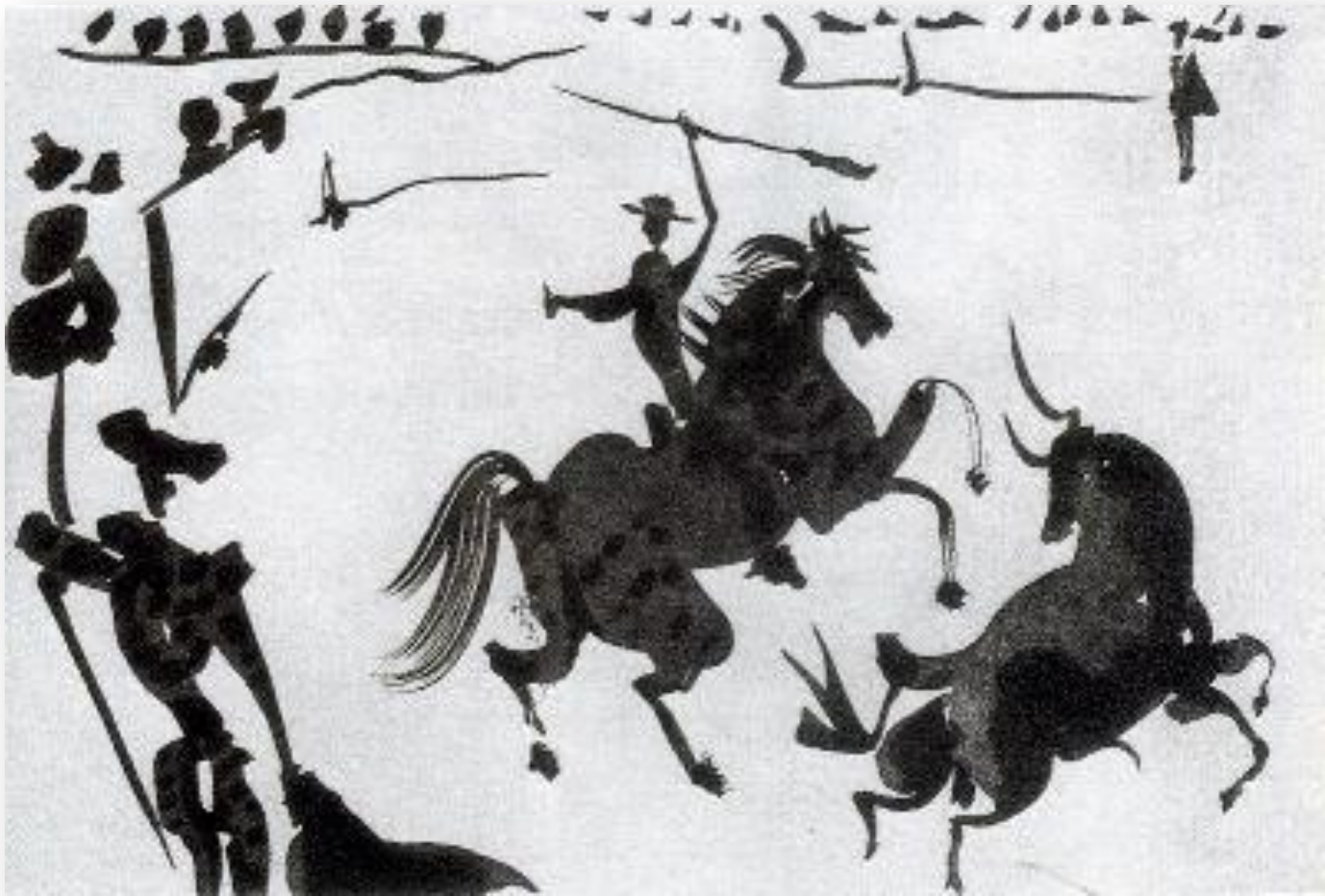
Torero de Pablo Picasso