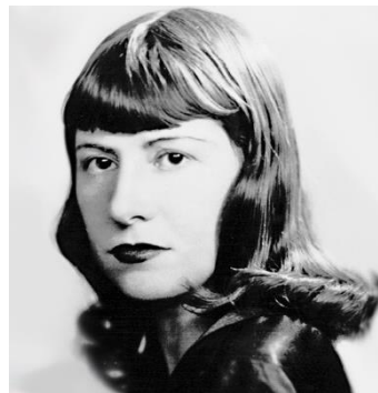
María Luisa Bombal