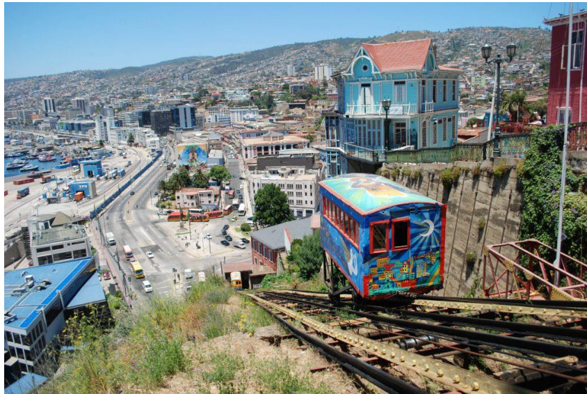
CERROS DE VALPARAISO