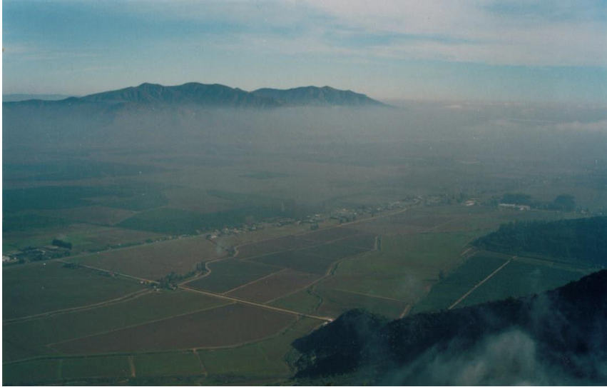
VALLE DEL CACHAPOAL