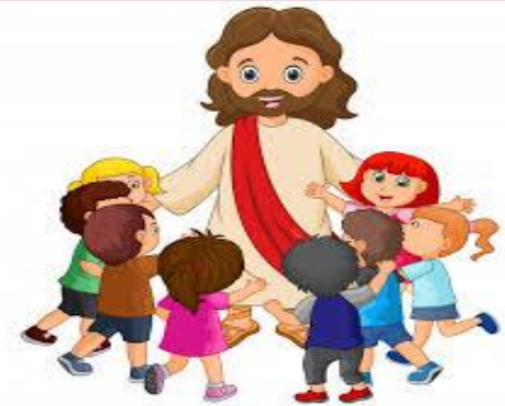
La persona de Jesús