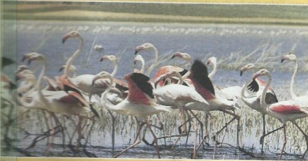
Dios puso la creación en manos del ser humano para que viviera feliz en ella y la cuidara.