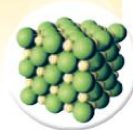
Partículas de sal