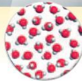
Partículas de agua