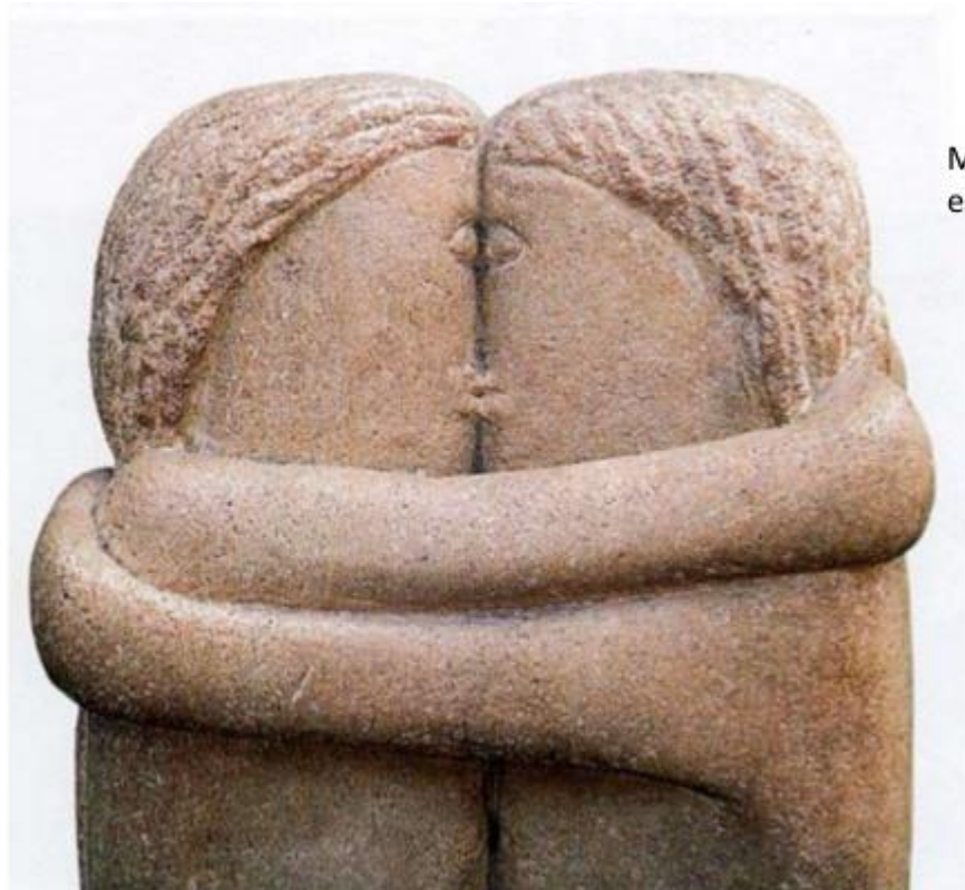
Medio clásico tridimensional: escultura