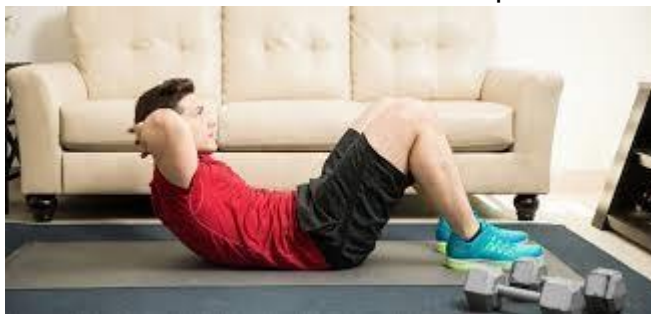
ejercicio mal realizado

Las manos no deben ponerse detrás de la nuca entrelazándose deben ponerse a los costados de la cabeza y no ayudarse a subir solo sube el cuello llegando a producir una lesión el torso debe subir junto con cabeza y cuello firmes tonificados deben realizar 40 abdominales repetir cuatro veces y pasar al siguiente ejercicio