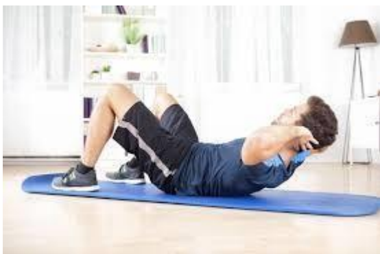
ejercicio bien realizado