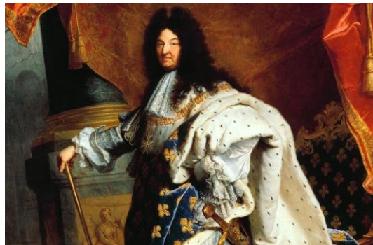
Luis XIV de Francia