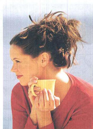
Cada persona debe elegir para su vida los ideales que desea.

Para los cristianos, Jesús es un llamado constante a la persona para que construya un proyecto de vida basado en el amor y en la entrega a los demás. Este mundo se puede mejorar desde el arte, desde la medicina, desde la ciencia, desde la política. Desde cada una de las posibles vocaciones, Dios llama constantemente a la autenticidad y a la entrega.