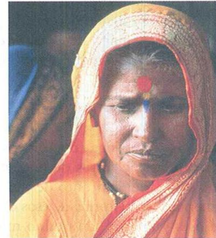
Para los hindúes, la felicidad o la desgracia son fruto de su conducta en vidas anteriores.