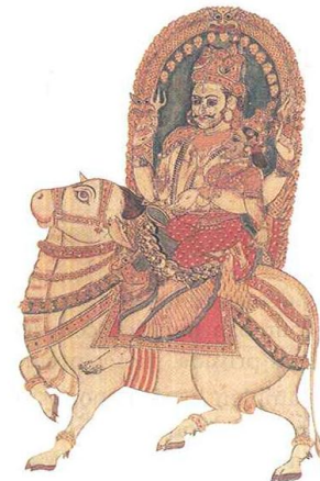
Siva, dios destructor del mundo.