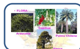
La flora chilena