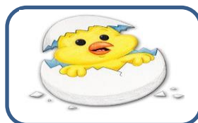
El nacimiento de un pollo